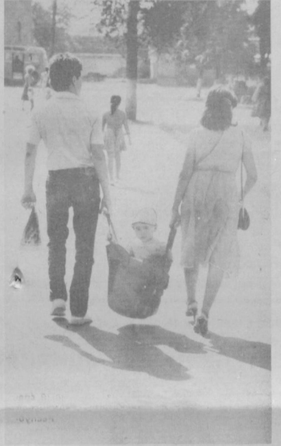
НА ПРОГУЛКЕ.