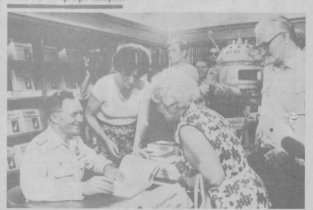
ГДР. Сотни берлинцев пришли в столичный книжный магазин «Карл-Маркс-буххандлунг», чтобы получить автограф Зигмунда Яена на недавно вышедшей в свет книге первого нюрнберга ГДР, в которой он рассказывает о своем полете совместно с В. Быковским на корабле «Союз».