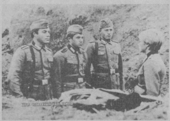
Производство киностудии имени М. Горького.

Главные герои фильма, действие которого происходит в 1944 году, — бесстрашные армейские разведчики, солдаты и офицеры. ...Группа разведчиков во главе с капитаном Спириным, передвигаясь в тройную форму сотрудников немецкой полевой полиции, переходят линию фронта и приступают к сбору необходимых советскому командованию разведданных. Так получилось, что вскоре был смертельно ранен Спирин, и группу возглавила капитан Надежда Мороз. Блестяще зная немецкий язык, она смело вступает в контакт с солдатами и офицерами противника. Однако у фашистов уже возникло подозрение, что у них в тылу действуют советские разведчики. Вокруг группы смыкается вражеское кольцо. В этих труднейших условиях, заведомо рискуя собственной жизнью, Надежда Мороз по радию открытым текстом передает добытые сведения.