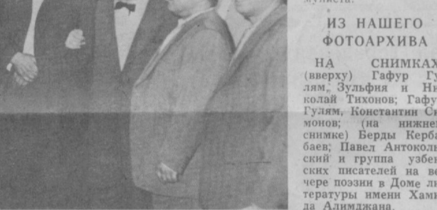
ИЗ НАШЕГО ФОТОАРХИВА

Высокое чувство ответственности перед своим народом, чувство своего долга перед ним всегда определяло гражданскую и поэтическую позицию Гафура Гуляма. Позицию художника-коммуниста.