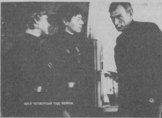
ШЕЛ ЧЕТВЕРТЫЙ ГОД ВОЙНЫ

Автор сценария — А. Беляев. Режиссер — Г. Николаенко. В ролях: Л. Савельева, Н. Олялин, А. Збруев, Н. Еременко и другие.