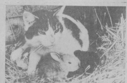
Добрым оказалось сердце у надменного красавца, и она решила пригреть осиротевших крольчат. Ну что тут поделаешь: ведь дети, хоть и чужие...

КРУПНЫЙ АУКЦИОН старинных бумажных денег был проведен в Лондоне. Наибольший интерес его участников вызвала китайская бумажная банкнота XIV века, напечатанная из коры тутового дерева. Еще один редкий «денежный знак», представленный на аукционе, — выпущенная в 1902 году банкнота достоинством 10 шиллингов, напечатанная на обрывке солдатского обмундирования. Такие деньги имели хождение во времена англо-бурской войны.