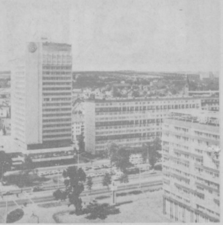
НА СНИМКЕ: панорама Эрфурта. В центре возвышается новая гостиница «Космос».