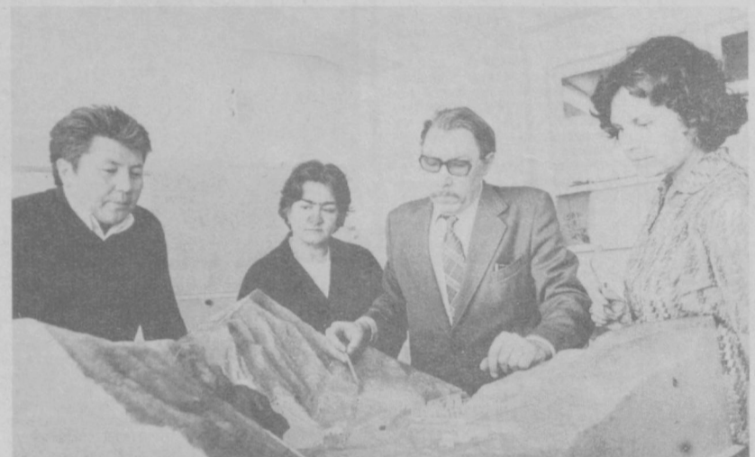
В ЛАБОРАТОРИЯХ УЧЕНЫХ