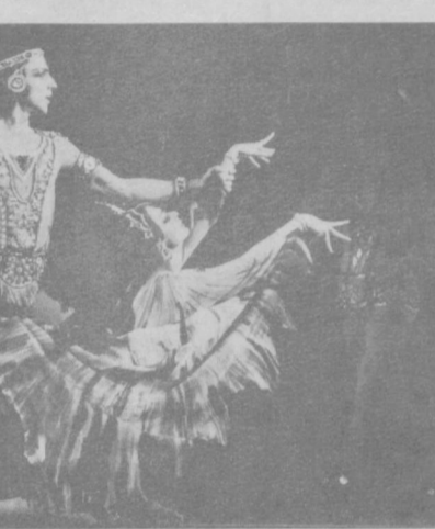
Юрий Григорович и балетмейстер Улугбек Мусаев в постановке балета «Индийская поэма» в Большом театре СССР.