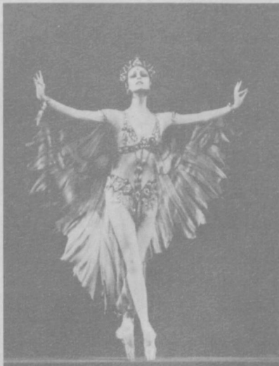
НА СНИМКАХ: сцены из балета «Индийская поэма» в постановке Большого театра Союза ССР.