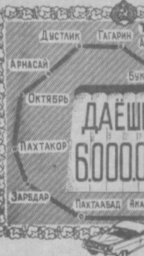
Репортаж наших специальных корреспондентов А. Хатамова, Х. Икрамова, А. Абдуразакова, А. Эгамназарова читайте на 3-й стр.

Узбекского радио и управления «Главташпассавтотранс» на хлопковых полях подшефных областей