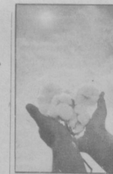
МАРШРУТАМИ ШЕСТИ МИЛЛИОНОВ

Богатый урожай хлопка-сырца созревает на полях совхоза «Дальварзин» Бектабадского района столичной области. На помощь земледельцам в дни «белой страды» приехали горожане.