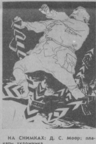
НА СНИМКАХ: Д. С. Мур; плакаты художника.