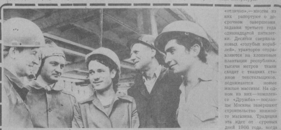
И. ВЕРНЫ ЗАВЕТАМ ИЛЬИЧА