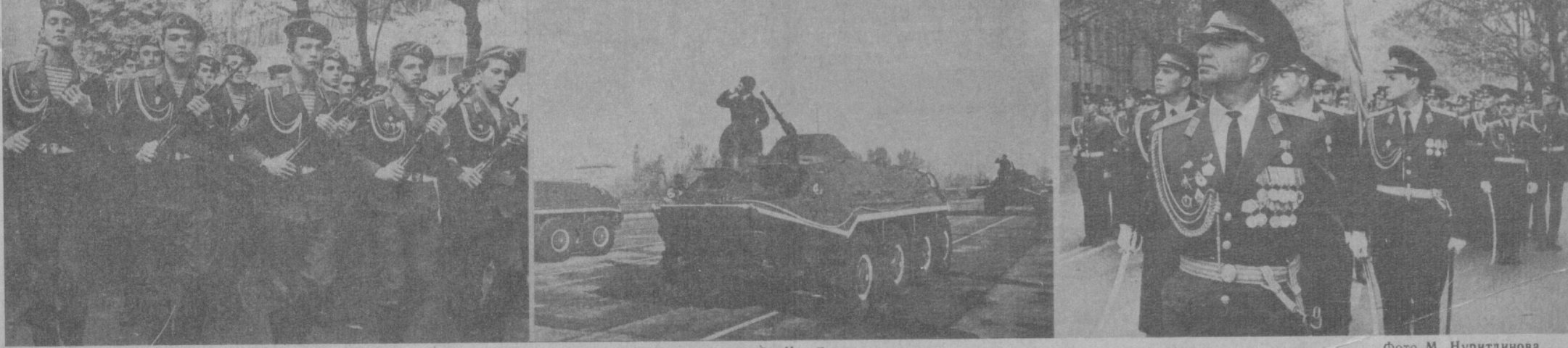
Ташкент, 7 ноября 1983 года. Демонстрация трудящихся и военный парад на площади имени В. И. Ленина.

Гремят праздничные марши. Звучат над площадью здравницы, славящие партию, народ, нерушимое единство коммунистов всего мира. Демонстрация трудящихся Ташкента явилась ярким олицетворением верности советского народа заветам В. И. Ленина, идеям Великого Октября.