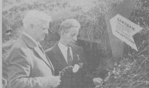
В середине октября 1943 года летняя кампания Советской Армии, начатая в июле Курской битвой, почти без паузы перешла в новую наступательную кампанию, продолжавшуюся до весны 1944 года. Главным ее событием стала битва за Днепр и Правобережную Украину, начавшаяся еще в 20-х числах сентября форсированием Днепра войсками Воронежского, Центрального, Степного и Юго-Западного фронтов.