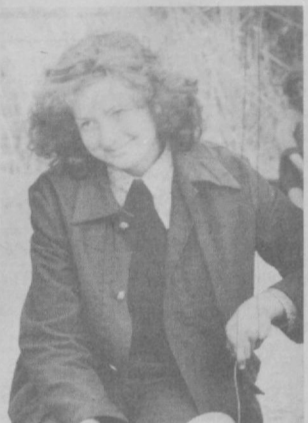
По-ударному трудятся на полях совхоза имени Волкова Ильичевского района Сырдарьинской области учащиеся Ташкентского государственного музыкального училища имени Хамзы.