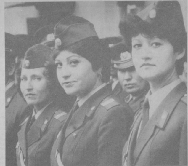
Сегодня — День советской милиции