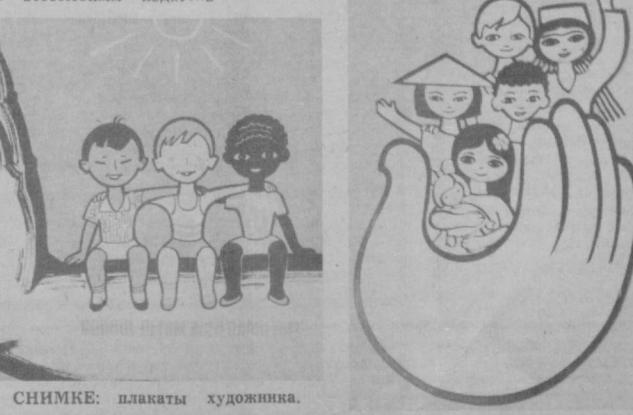
НА СНИМКЕ: плакаты художника.

площены в плакатах «Мир, Дружба», «Чили», «Час пробил», «Империализм», а также в работах «Мир против войны», «Свист под дубом», «Нет империализму!», представленных на третьей международной выставке. Завоевал популярность и его политический плакат «Нет!» — гониме вооруженный, выпущенный всесоюзным издательством «Плакат».