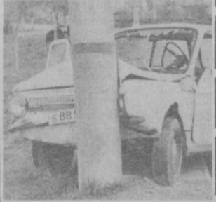
К чему ведет превышение скорости.

закрыта для движения транспорта улица Абая от улицы Укчи до ул. 9 Января. УГАИ УВД Ташгорисполкома.