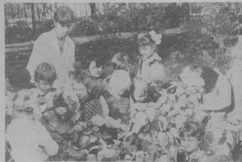
В детском саду № 11 текстильного комбината. Фото У. Усманова. Редактор Ш. О. УБАЙДУЛЛАЕВ.

ком лазера. Отражаясь от алмазных граней, лучи попадают на специальный экран, покрытый фоточувствительным материалом. Так получается структурное изображение драгоценного камня — рефлектограмма. (Корр. ТАСС)