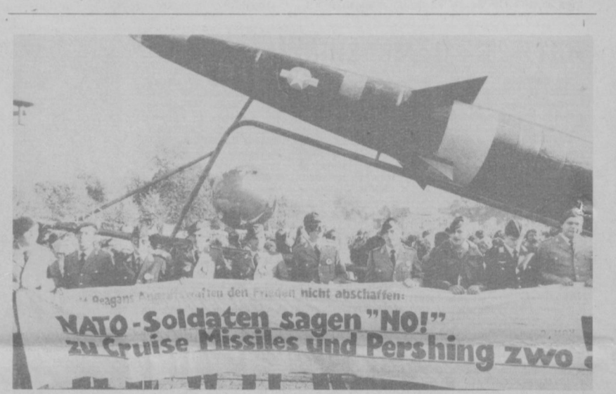
ФРГ. Миллионы западногерманских граждан требуют, чтобы власти отказались от осуществления решения НАТО, в результате которого их страна превратится в стартовую площадку для американского ракетно-ядерного оружия. В грандиозной манифестации вооруженной, устроенной в Бонне, приняли участие сторонники мира, представлявшие различные слои населения, социальные группы, любуемые.