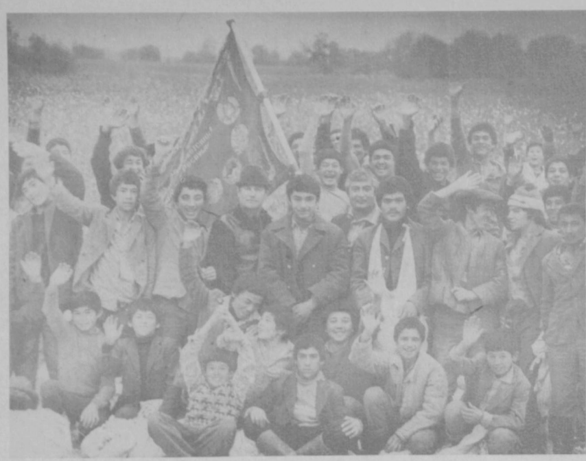
• МАРШРУТАМИ ШЕСТИ МИЛЛИОНОВ