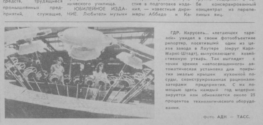
ГДР. Карусель... «летающих тарелок» увидел в своем фотообъективе репортер, посетивший один из цехов завода в Лаутере (округ Карл-Маркс-Штадт), выпускающего хозяйственную утварь. Так выглядит с точки зрения «неповеселенного» автоматическая установка для полировки эмалированных крышек кухонной посуды, сконструированная рационализаторами предприятия. С их помощью здесь каждый год модернизируется или обновляется около 25 процентов технологического оборудования.

ИЗ ПЕРСПЕКТИВЫ ЯИЦ... Венгерское объединение «Интеркэмия» приступило к выпуску новой группы косметических средств под названием «Тетис». Маски для кожи, шампунь и косметическая пена этой группы содержат в себе консервированный концентрат из перепелиных яиц.