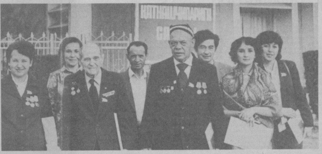
НА СНИМКЕ: группа делегатов Чиланзарского района.