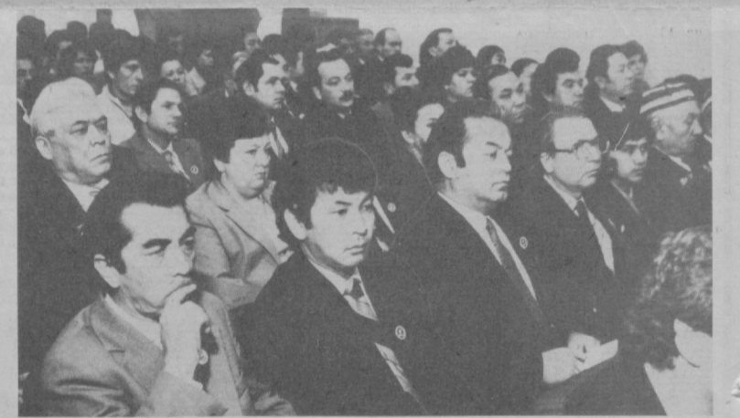
НА СНИМКЕ: в зале заседаний партийной конференции Октябрьского района.