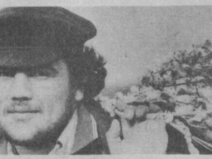
100 килограммов подбора хлопка.

ПО СТРАНИЦАМ УТРЕННИХ ГАЗЕТ Дальнейшее углубление дружбы и всесторонних связей между СССР и СФРЮ отвечает интересам советского и югославского народов, делу мира и социализма. Об этом говорились 28 ноября на торжественном собрании представительства СФРЮ в Ташкенте, отвечая интересам со-