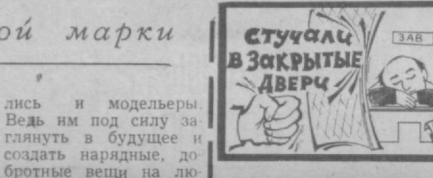
Стучат в закрытые двери

76 видов изделий ташкентского производственного объединения «Малика» отмечены государственным Знаком качества. В общем объеме производства доля этой продукции составляет 22,8 процента.