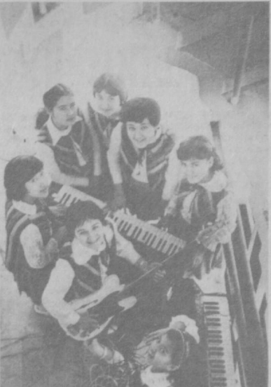
«Иллуфар» — так называется новый вокально-инструментальный ансамбль музыкального интерната имени Глиэра. Руководит ансамблем А. С. Гродский. НА СНИМКЕ: участники ансамбля — семиклассники интерната.

Сейчас те, от кого зависит порядок, стремятся всячески подчеркнуть обыкновенность этого класса. И недоумевают, зачем