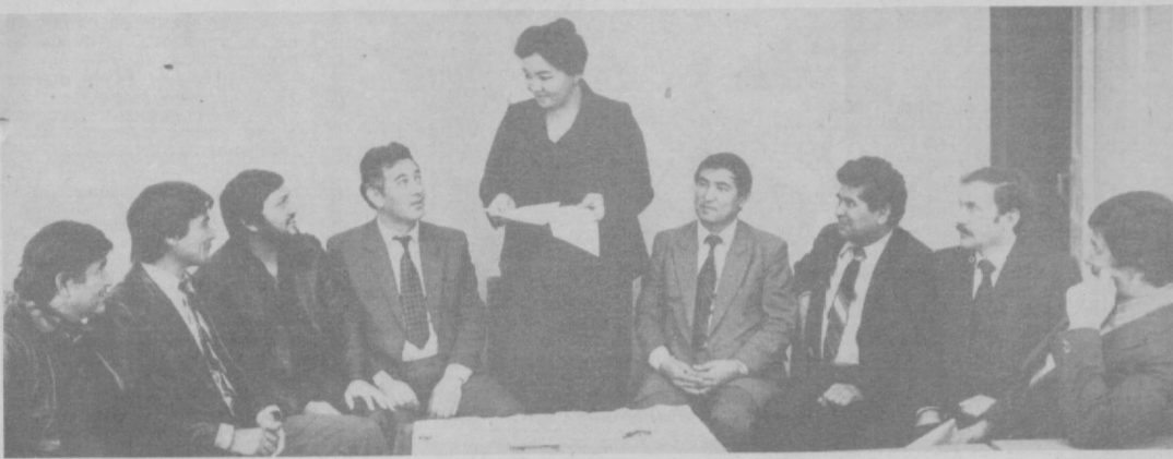
НА СНИМКЕ: творческая молодежь Узбекистана — выпускники Литературного института имени А. М. Горького и Высших литературных курсов института.

Исполнилось полвека Литературному институту имени А. М. Горького Союза писателей СССР. За заслуги в подготовке творческих кадров Советской многонациональной литературы Президиум Верховного Совета СССР наградил институт орденом Дружбы народов.