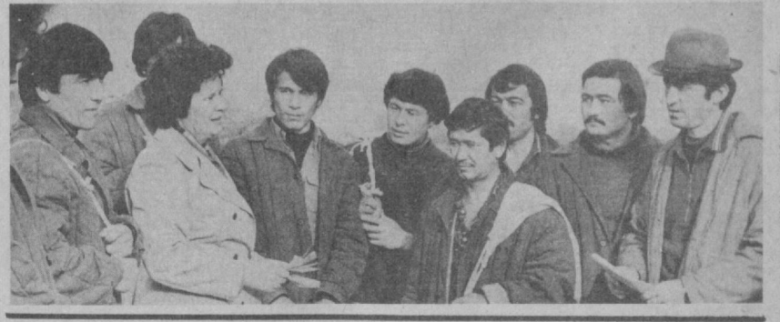
• В ПОСЛЕДНИЙ ЧАС ВПЕРВЫЕ В ТАШКЕНТЕ