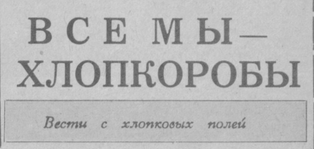
Вести с хлопковых полей