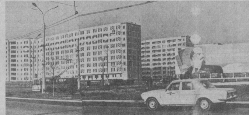
НА СНИМКЕ: Ташкент сегодня. Жилые кварталы Ц-17, Ц-18.