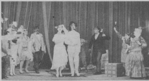
Новости театра — в фотографиях ЗА ПРЕМЬЕРОЙ — ПРЕМЬЕРА

Последний месяц года ознаменован целым рядом интересных театральных премьер.