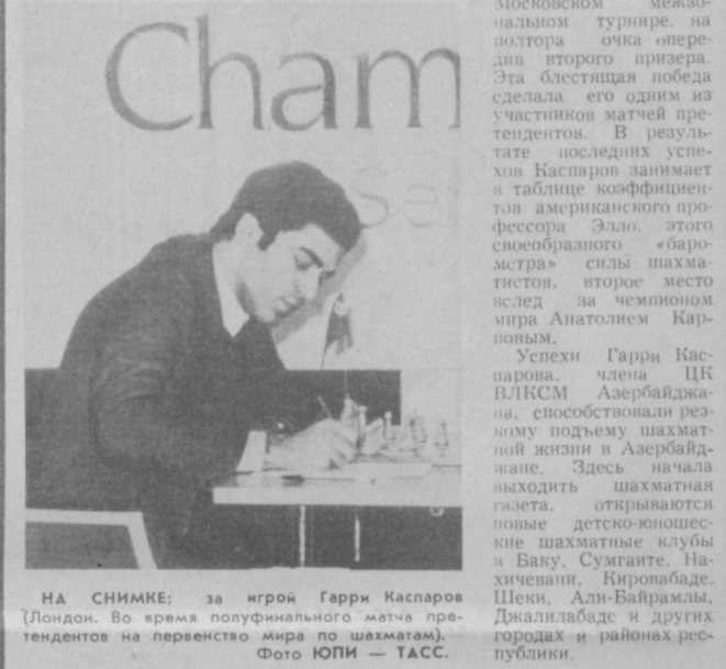
НА СНИМКАХ: за игрой Гарри Каспаров (Лондон). Во время полуфинального матча претендентов на первенство мира по шахматам.