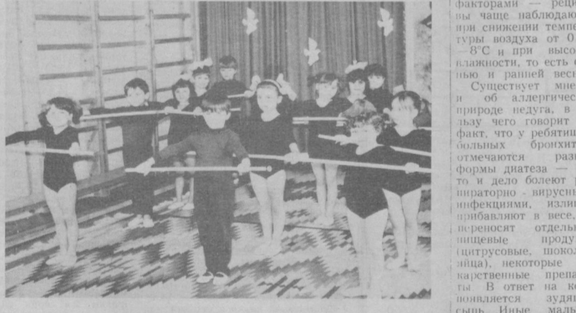
ло и интересно в детском саду, чтобы они знали больше сказок и стихов, умели рисовать, работать с пластилином. В. ЛИДИНА.

Веселая предпраздничная суматоха царит в детском комбинате № 1 производственного объединения «Ташкентский тракторный завод имени 50 летия СССР». Идет подготовка к новогодней елке — самому веселому и радостному празднику детворы. Шьются костюмы, разучиваются песни, примеряются маски, пополняются новыми детскими работами выставка «Дадим шар земной детям». С 1980 года работает детский комбинат, но уже занимает одно из первых мест в социалистическом соревновании