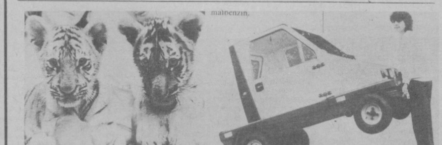
БЕРЛИН. Эти два очаровательных тигра появились на свет несколько месяцев назад в столичном зоопарке. Малыши отличаются отменным здоровьем и покладистым нравом. Любопытны отметить, что и их мамы в свое время были

раритетом, имеет размеры — 2,13 метра в длину и 1,2 — в ширину. Развиваемая предельная скорость при рабочем объеме цилиндра 50 кубических сантиметров — около 25 километров в час. На сто километров пути автомобиля расходует три