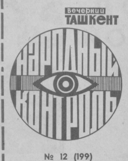
№ 12 (199)

СЕРГЕИЙСКИЙ РАЙОН. Повторный рейд, проведенный дозорными завода солнечезащитных устройств, показал, что на предприятии значительно сократилось количество нарушений трудовой дисциплины. Вместе с тем имелись случаи нарушения пропускного режима и скрытия прогулов. Итоги рейда рассмотрены на заседании бюро группы народного контроля. По материалам его по заводу издан приказ, согласно которому виновные привлечены к административной ответственности.