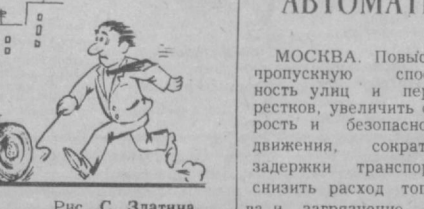
Подвешь?