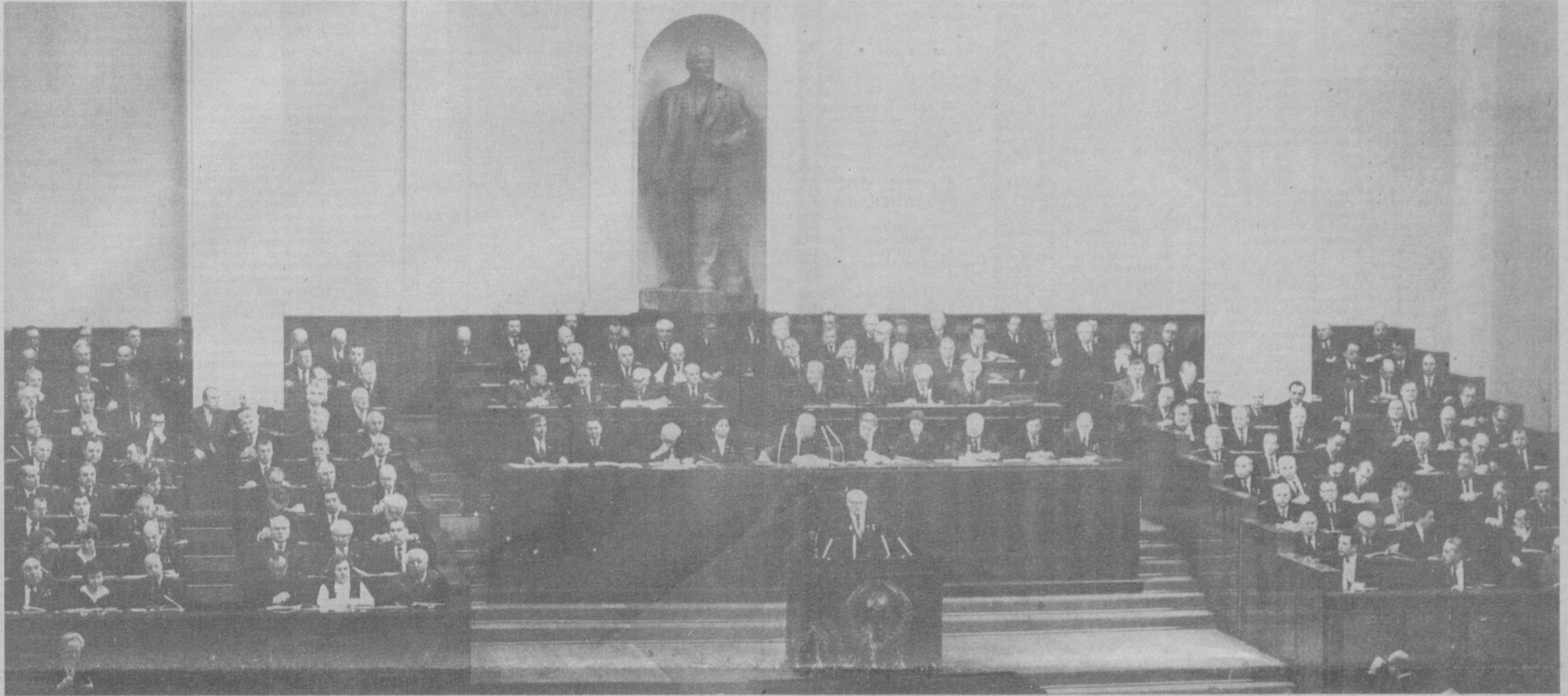
Москва. Кремль. Девятая сессия Верховного Совета СССР десятого созыва. На снимке: совместное заседание Совета Союза и Совета Национальностей.