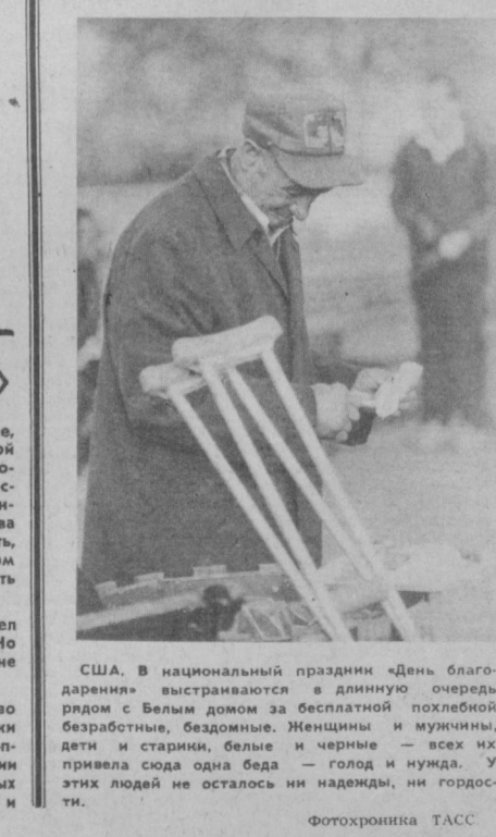
США. В национальный праздник «День благодарения» выстраиваются в длинную очередь рядом с Белым домом за бесплатной похлебной безработные, бездомные. Женщины и мужчины, дети и старики, белые и черные — всех их привлекла сюда одна беда — голод и нужда. У этих людей не осталось ни надежды, ни гордости.

Голодающих в самой богатой стране капиталистического мира становится все больше и больше. Особенно ускорился этот трагический процесс при администрации президента Рейгана, которая безжалостно урезает ассигнования на социальные программы, выкраивая таким образом новые средства на военные расходы. За два года пребывания у власти нынешней администрации число голодных американцев увеличилось на несколько миллионов и достигло 34 млн. человек.