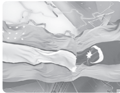
Президент Шавкат Мирзиёев ва Озарбайжон Республикаси Президенти Илҳом Алиев ТЕЛЕФОН ОРҚАЛИ мулоқот қилди.