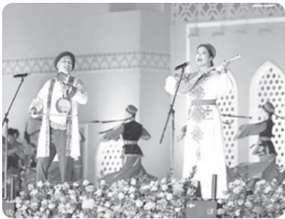
Президентимиз IV халқаро бахшичилик санъати фестивали иштирокчиларига ТАБРИК йўллади.