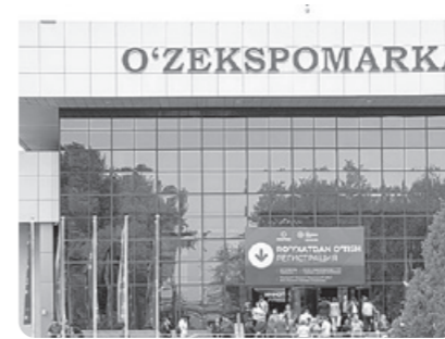
Президент Шавкат Мирзиёев “ИННОПРОМ. Марказий Осиё” V халқаро саноат кўргазмасига ташриф буюрди.