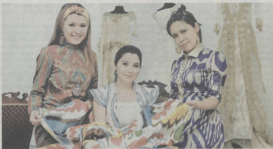
Обеспеченность интересной работой – важнейшая составляющая социальной защиты женщин.