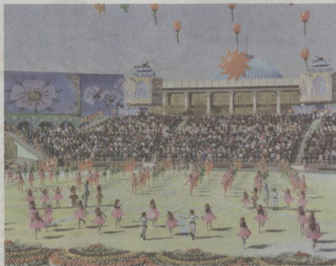
В Национальном парке Узбекистана имени Алишера Навои состоялись торжества, посвященные празднику Навруз

С праздником Навруз, дорогие мои друзья!