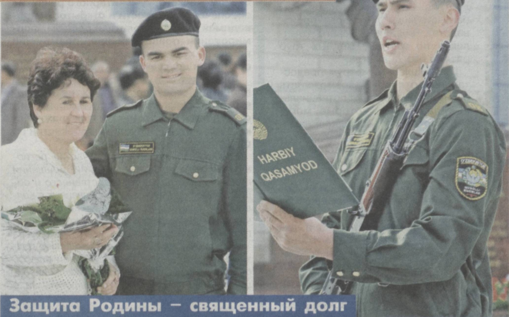
Защита Родины – священный долг