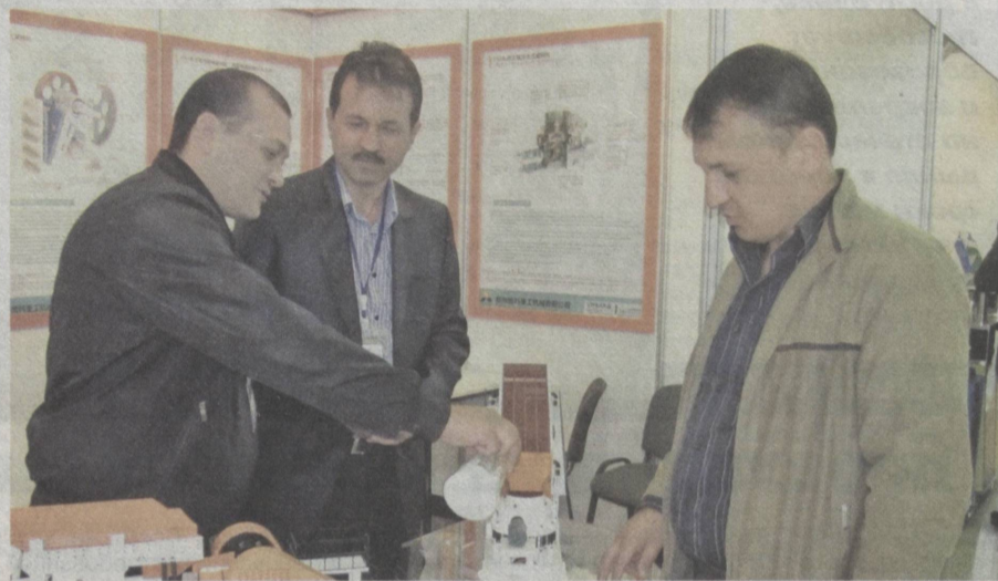
Продолжает работу промышленный форум в Ташкенте.

Участники мероприятия получили ответы на интересовавшие их вопросы.