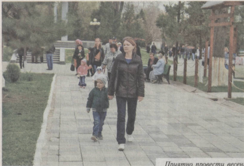
Приятно провести весенний день в одном из парков столицы.