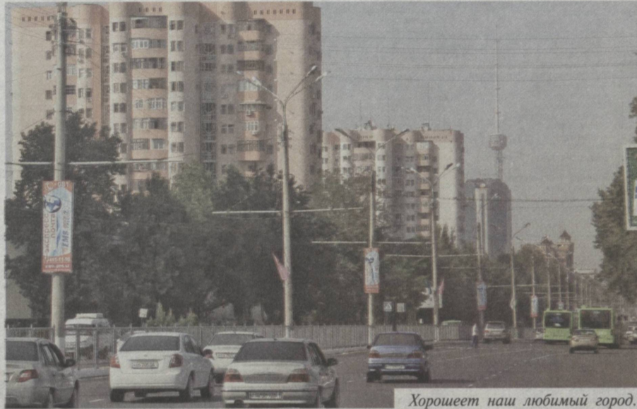
Хорошеет наш любимый город.

хорошо звучал, но и был красивым, доставлял людям радость и удовольствие. Используем в работе только самый лучший природный материал: урючину, тутовник, орешину и, конечно, свои руки, опыт и секреты мастерства деда, отца. Главные качества, которыми должен обладать человек нашей профессии, – абсолютный музыкальный слух, терпение, знание свойств дерева, чистая душа, умелые руки, доброе сердце и гордость за страну, в которой живешь.