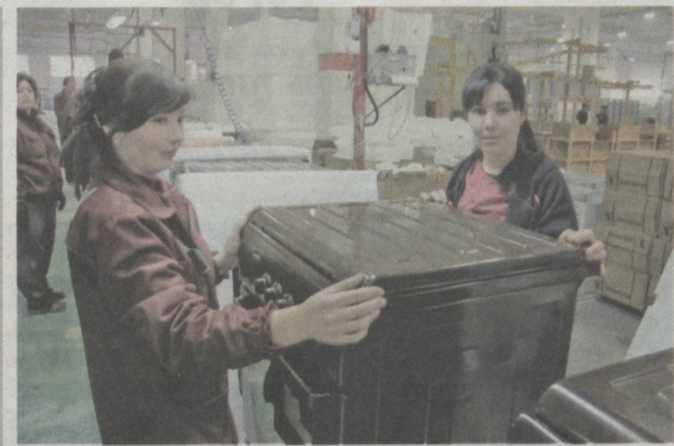
С каждым годом увеличивается спрос на отечественные товары.