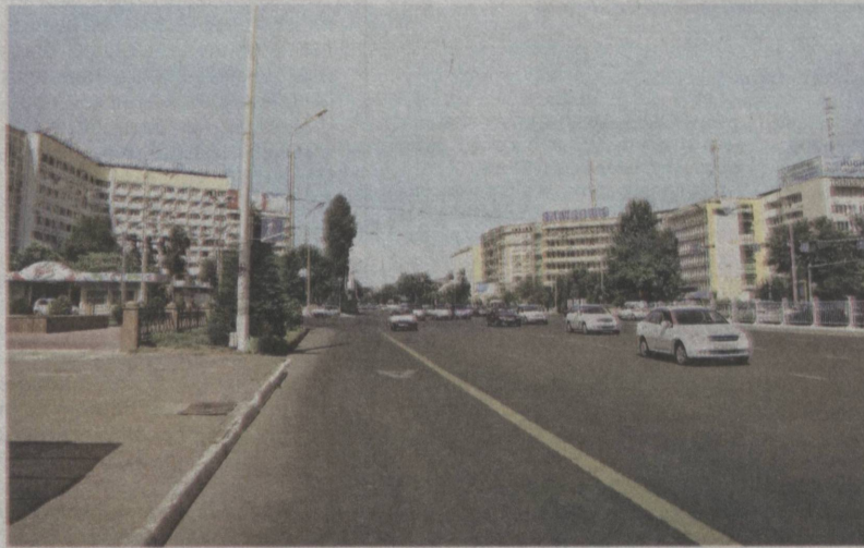
В благоустройстве города активно участвуют субъекты малого бизнеса.

Успешно функционировать малым предприятиям помогают созданные благоприятные условия, упрощение процедуры получения разрешений на предпринимательскую деятельность, ежегодное снижение ставки единого налогового платежа. В Указе Президента страны «Об углублении экономических реформ и ускорении развития промышленности строи-