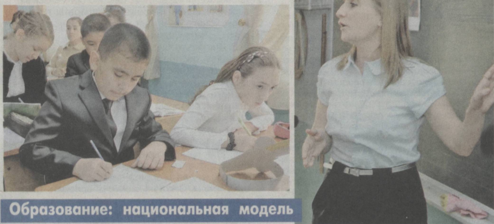
Образование: национальная модель