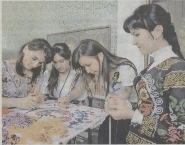
Мир творчества.