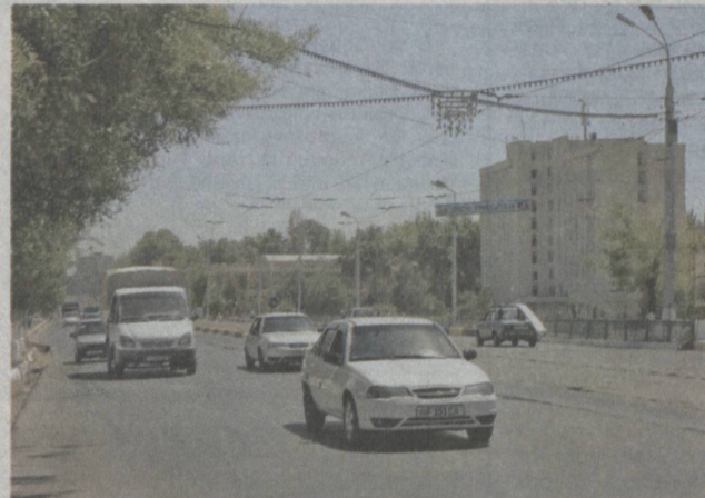
Широкие современные автомагистрали — залог безопасности водителей и пешеходов.