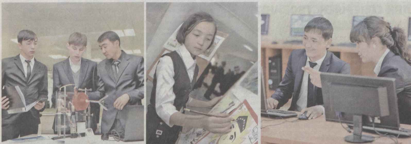
Под руководством Президента Ислама Каримова проводится масштабная работа по воспитанию физически, интеллектуально и духовно развитого поколения, способного на деле стать ведущей силой осуществляемых в стране преобразований.

Благополучие и процветание любой страны во многом определяется уровнем образования молодежи, ее готовности взять на себя ответственность за будущее государства, умением решать сложные и широкомасштабные задачи в процессе формирования демократического общества.