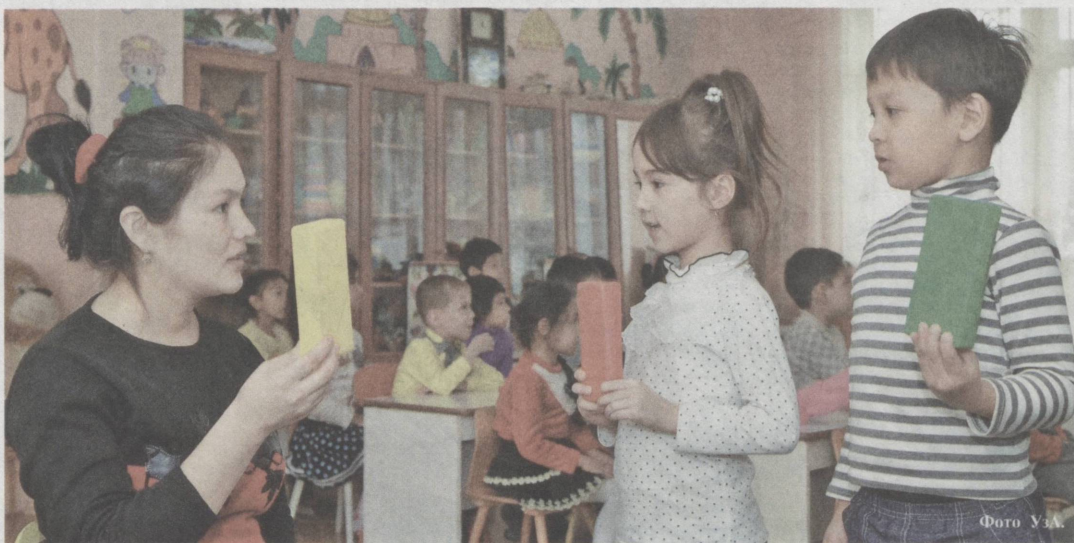
Знакомство с миром знаний начинается в раннем детстве.