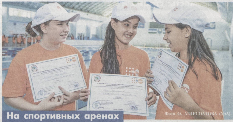
На спортивных аренах