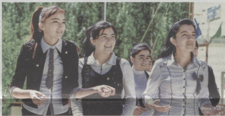
Современным девушкам предоставлены все условия для получения образования и перспективной профессии.

2016 год – Год здоровой матери и ребенка