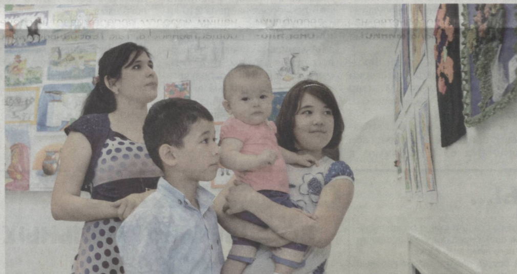
Приобщаясь к миру искусства с раннего детства.