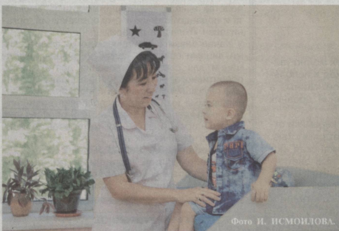
Охрана материнства и детства – одна из важнейших задач.