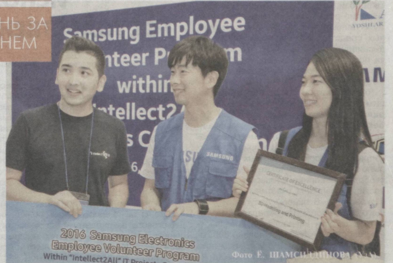
2016 Samsung Electronics Employee Volunteer Program Within "Intellect2All" IT Project

В Ташкенте во Дворце творчества молодежи поощрена молодежь, активно участвовавшая в учебных семинарах, организованных для победителей территориальных этапов конкурса проектов по информационным технологиям «Интеллектуал».