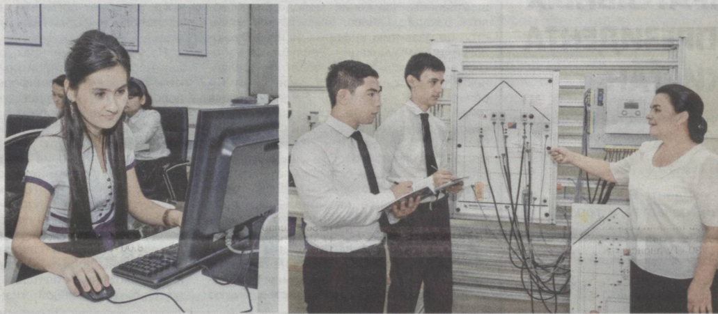
Наша молодежь успешно овладевает ИКТ.