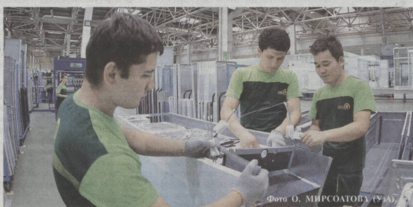
Наши товары пользуются стабильным спросом на внутреннем рынке.

Международный фестиваль «Itaewon Global Village Festival 2016» послужил широким ознакомлению мировой общественности с возможностями нашей страны в сферах искусства, культуры, туризма, развитию двустороннего и многостороннего взаимовыгодного сотрудничества, дальнейшему укреплению дружеских связей.