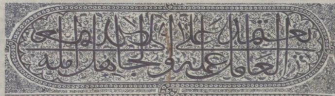
Эта надпись сделана на одном из памятников Аксарай.

Умный полагается на свой труд, а глупый полагается на свои надежды.