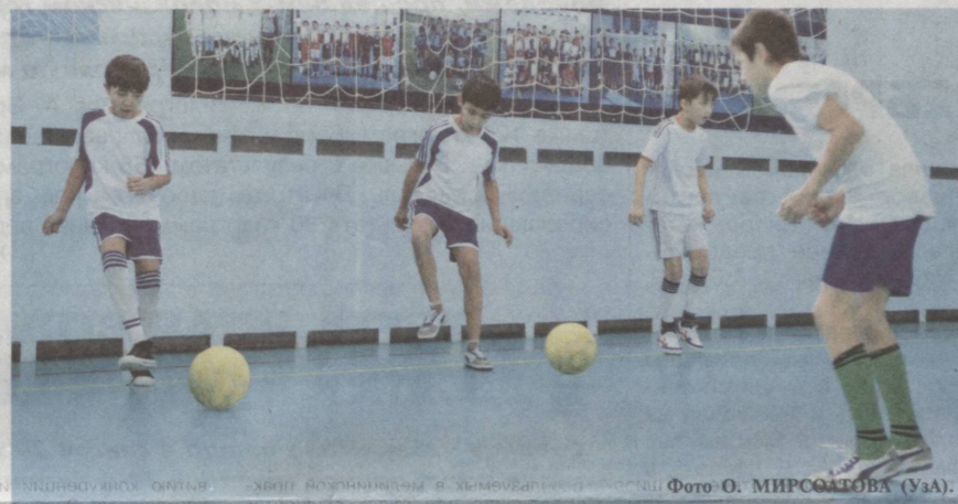
Спорт укрепляет здоровье и воспитывает силу воли.