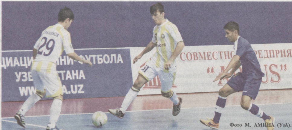
Все виды спорта служат улучшению физического состояния молодежи.