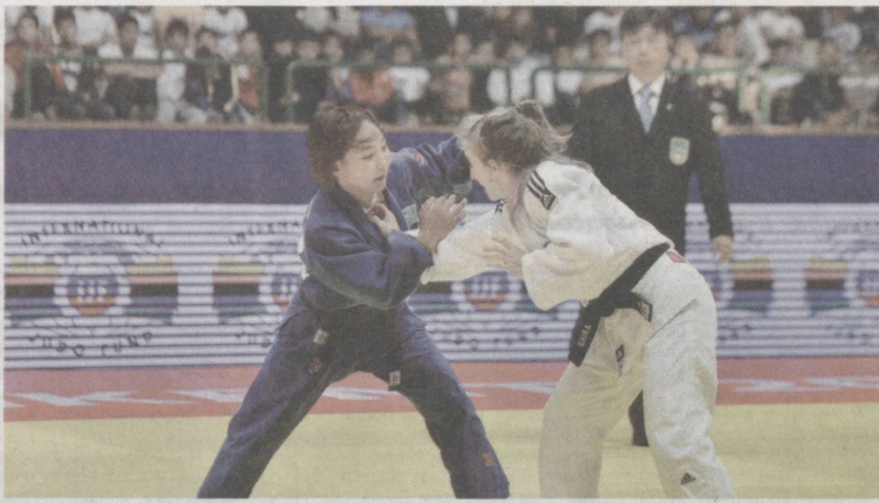
Достижения в спорте прославляют страну.