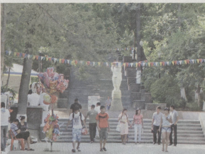
Наша столица заметно преобразилась в эти солнечные летние дни.