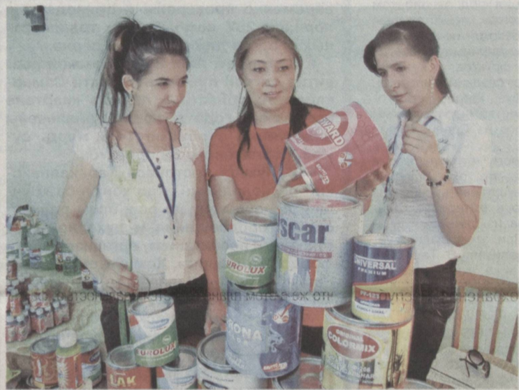
Покупатель всегда выбирает лучшее.