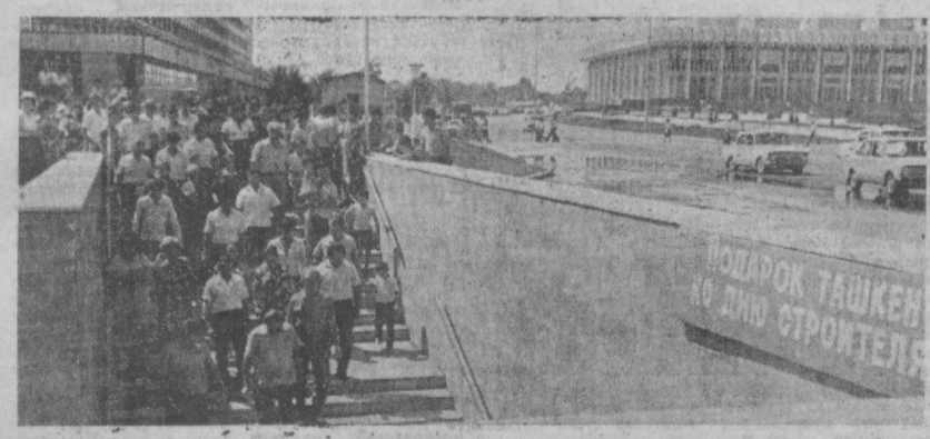
В КАНУН ДНЯ СТРОИТЕЛЯ ВСТУПИЛ В ЭКСПЛУАТАЦИЮ НОВЫЙ ПОДЗЕМНЫЙ ПЕШЕХОДНЫЙ ПЕРЕХОД НА СТАНЦИИ МЕТРО «ДРУЖБА НАРОДОВ».

И завершили работу свои товарищи по управлению благоустройством, возглавляемые заслуженным строителем республики Ильфамом Ахмадуллин. Все вместе они освоили на строитель-