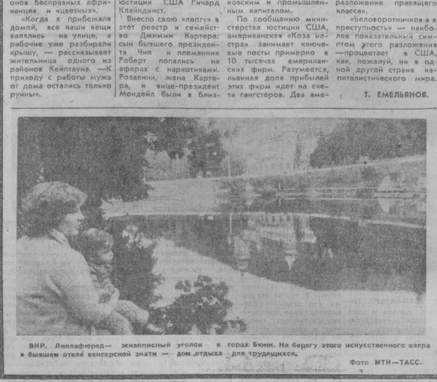
ВНР. Лиллафред — живописный уголок в горах Буево. На берегу этого искусственного озера в бывшем отеле венгерской знати — дом отдыха для трудящихся.

брании поликлиники, факты подтвердились. За несвоевременное разрешение жалобы большой Каримовой объявлен выговор. Врач Григорьян освобождена от занимаемой должности.