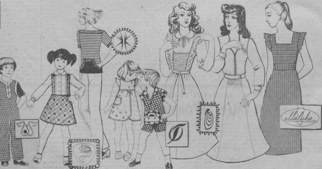
ЦЕНТРАЛЬНОЕ ПРОЕКТНО-КОНСТРУКТОРСКОЕ ТЕХНОЛОГИЧЕСКОЕ БЮРО МИНИСТЕРСТВА ЛЕГКОЙ ПРОМЫШЛЕННОСТИ УЗБЕКСКОЙ ССР.