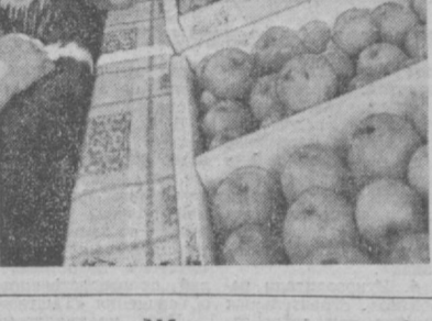
Характерно, что в магазине всегда хорошее качество овощей и фруктов, высокая культура обслуживания.

До десяти тонн овощей и фруктов реализует ежедневно магазин № 7 Ленинского района, расположенный на Госпитальном рынке. Покупатели могут приобрести здесь различную сельскохозяйственную продукцию, выращенную в хозяйствах Ташкентского района. Труженики села доставляют картофель, яблоки, болгарский перец, виноград, баклажаны и многое другое.